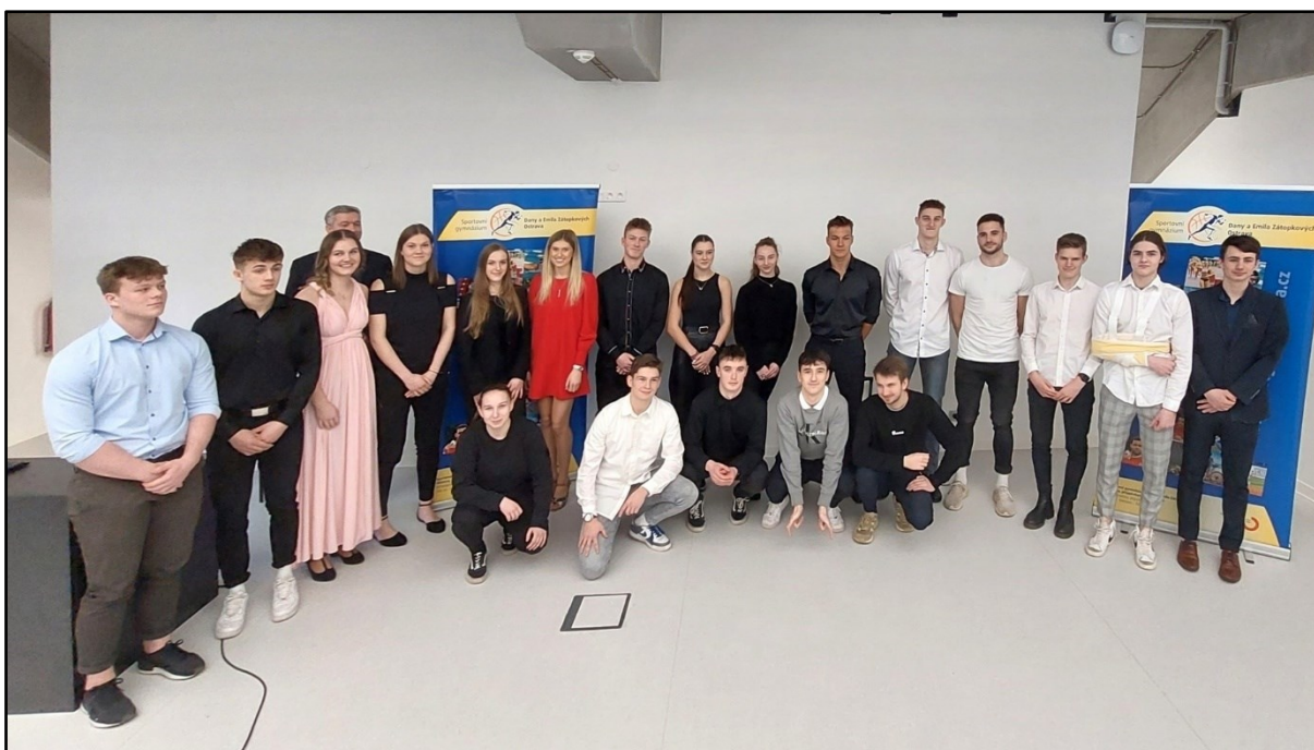
Nejúspěšnější sportovci školy za rok 2022 po slavnostním vyhlášení v prostorách kampusu Ostravské univerzity.

Vysoký kredit na veřejnosti si škola udržuje dlouhodobě a to na základě kvalitních výsledků žáků ve sportovních soutěžích a to nejen celorepublikových, ale i mezinárodních. Spolupráce školy s managementy sportovních klubů působících v Ostravě a okolí je promyšlená a koordinovaná. Škola každoročně pořádá vyhodnocení nejúspěšnějších sportovců za daný kalendářní rok. Za kalendářní rok 2022 propěhlo vyhodnocení v nových prostorách Ostravské univerzity Ostrava City Campus. Škola se často veřejně prezentuje také jako spolupřátel významných sportovních soutěží a turnajů. Některé z nich byly pořádány ve vlastních prostorách sportovní haly Plzeňská, další pak na sportovištích partnerských sportovních klubů.