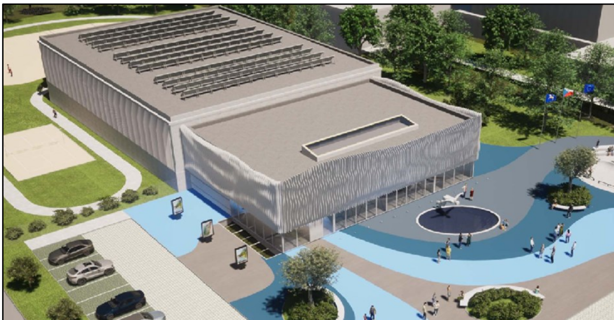
Vizualizace studie sportovního plaveckého bazénu v Ostravě-Zábřehu

V průběhu školního roku 2022/2023 zorganizoval zřizovatel výběrové řízení na dodavatele projektové dokumentace a následně probíhala spolupráce s vítězným projektantem na investiční akci „Plavecký bazén Sportovního gymnázia Dany a Emila Zátopkových“. Místem výstavby bude ulice Středoškolská.