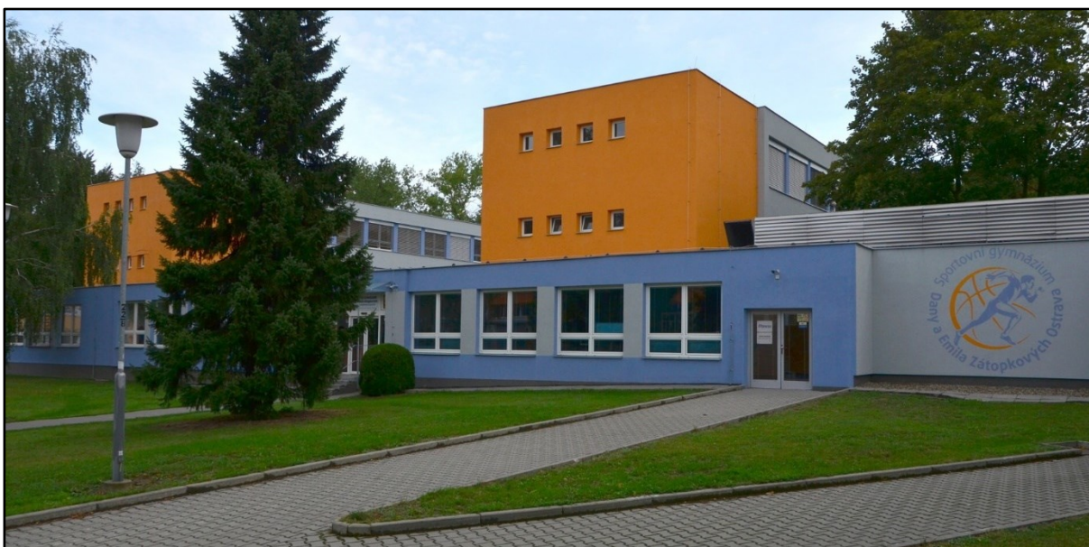
Areál Sportovního gymnázia Dany a Emila Zátopkových Ostrava

V listinné podobě je zpráva uložena na sekretariátě školy.