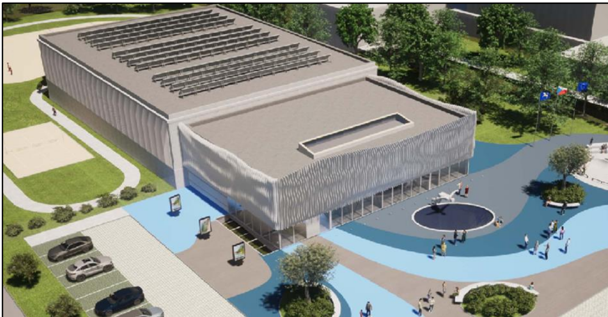
Vizualizace studie sportovního plaveckého bazénu v Ostravě-Zábřehu

V průběhu školního roku 2020/2021 byla na základě výběrového řízení a na základě podkladů zřizovatele školy MSK zadána studie na další významnou investiční stavbu „Plavecký bazén Sportovního gymnázia Dany a Emila Zátokových“. Místem výstavby je ulice Středoškolská.