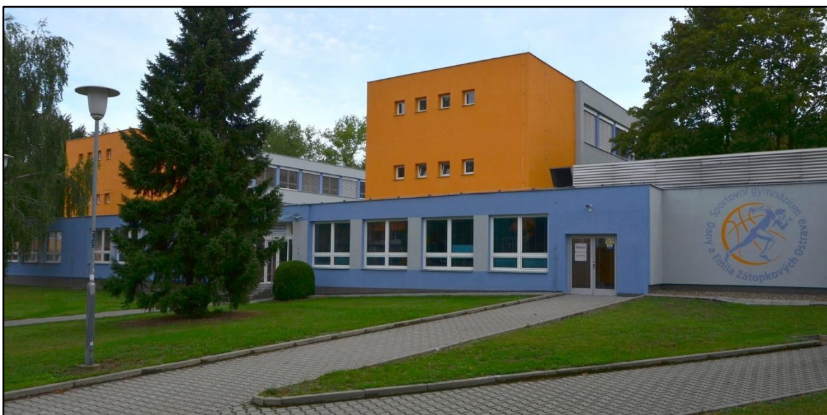
Areál Sportovního gymnázia Dany a Emila Zátopkových Ostrava

V listinné podobě je zpráva uložena na sekretariátě školy.