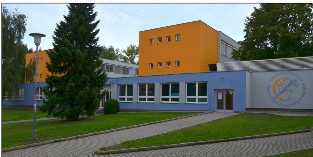
Areál Sportovního gymnázia Dany a Emila Zátopkových Ostrava

V listinné podobě je zpráva uložena na sekretariátě školy.