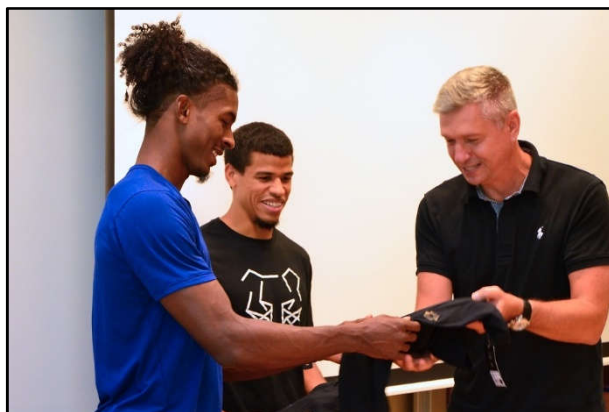
Před 58. ročníkem mítinku Zlatá tretra navštívili školu američtí atleti – Jarret Eaton a Bryce Robinson.

Žáci školy se ve školním roce 2018/2019 účastnili vědomostních a sportovních soutěží s dobrými výsledky. Konkrétní výsledky jsou uvedeny v příloze č. 6.