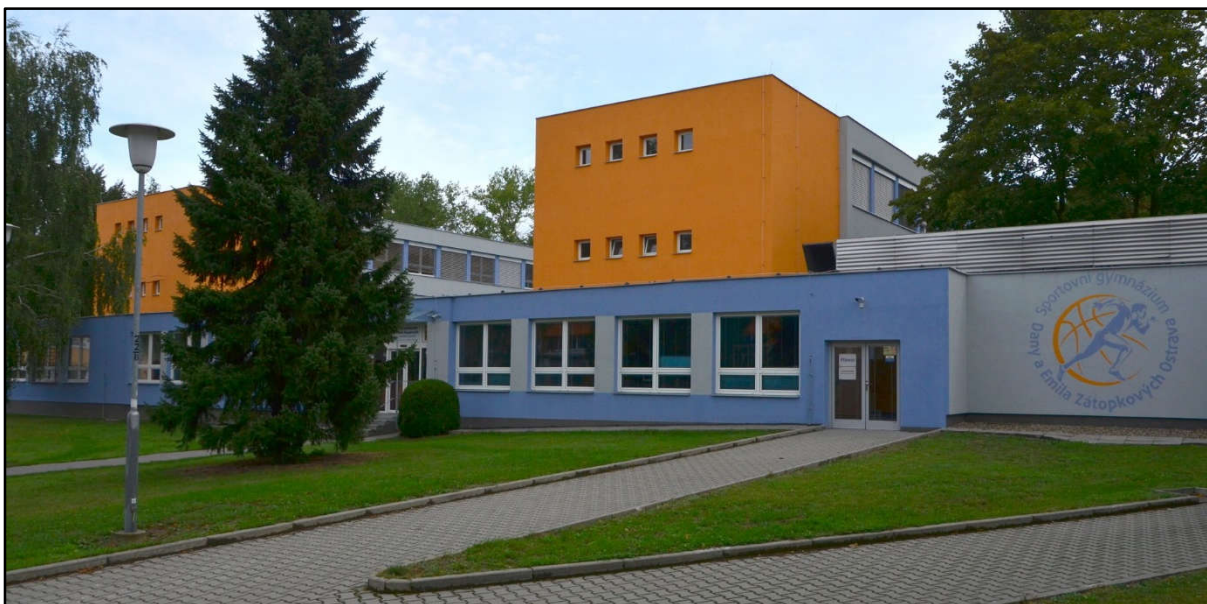
Areál Sportovního gymnázia Dany a Emila Zátopkových Ostrava