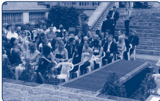
Po červeném koberci jako celebrita.