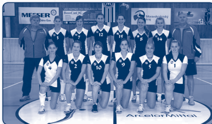
kadetky TJ Mittal Ostrava - vicemistryně ČR 2009