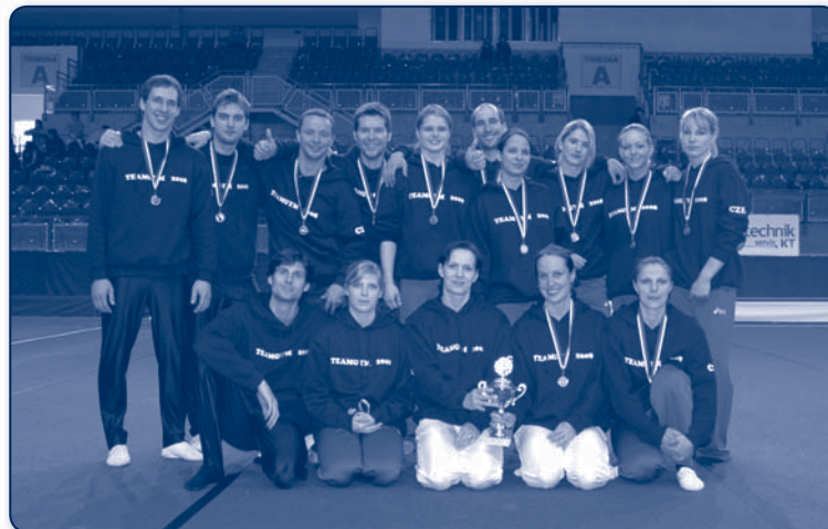
MM ČR TeamGym 2008 GK Vítkovice, Mistr ČR