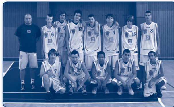
BCM Slezská Ostrava - kadeti