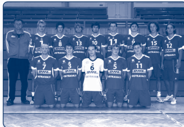
Junioři VK DHL Ostrava (nahore)