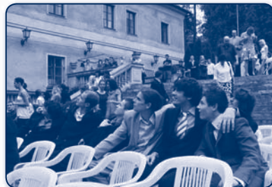
Náš maturant hledí vstříc jasné budoucnosti.