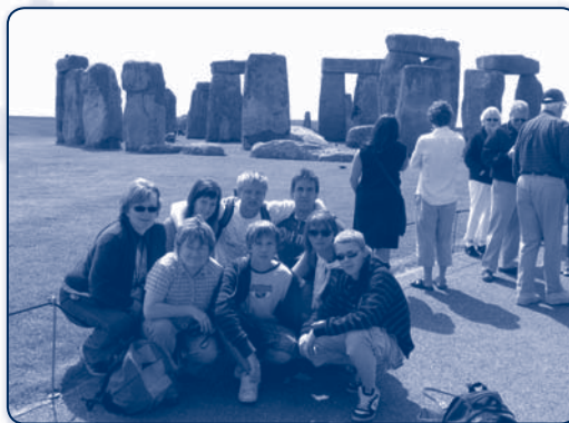
Studenti v Anglii

V roce 2009 jsme navázali na tradici exkurzí pořádaných sekci německého jazyka. Studenti vyšších ročníků vyrazili v doprovodu lektorek do velikonočně naladěné a vyzdobené Vídně, kde společně strávili jeden jarní den, zakončený v zábavním parku Prater. A co třeba příště navštívit „perlu na Labi“ – Drážďany?