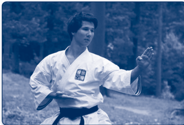
Jakub Debrecényi - reprezentant ČR, karate

Žáci tohoto oboru vzdělávání mají 5 hodin tělesné výchovy týdně. Rozsah teoretických předmětů je totožný jako u oboru vzdělávání Gymnázium se sportovní přípravou. Obor vzdělávání se osvědčuje jako ideální vstupenka pro další studium na vysoké škole tělovýchovného zaměření. Skloubení výkonnostního sportu, všestranně zaměřené tělesné výchovy a gymnaziálního studia se dlouhodobě prokazatelně osvědčilo. Řada vrcholových sportovců – reprezentantů ČR studuje podle individuálních vzdělávacích programů