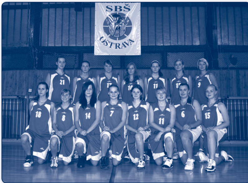
SBS Ostrava - starší dorostenky