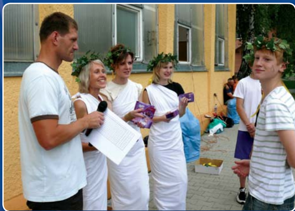
Antické božstvo odměňuje nejúspěšnější