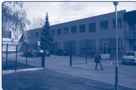
Vizualizace rekonstrukce Domova mládeže