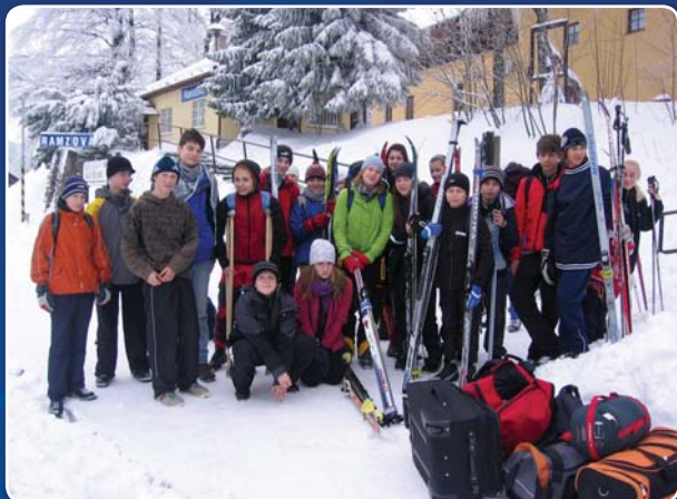
Nižší ročníky SG využili pohostinosti Jeseníků