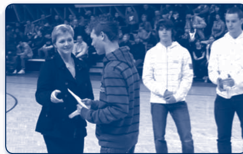
Sportovci SG přijímají gratulaci od bývalé vynikající atletky Tani Netoličkové