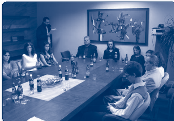
Přijetí nejúspěšnějších sportovců školy u hejtmana MS kraje

Poděkování za ojedinělou pedagogickou práci patří samozřejmě také trenérům našich sportovců.