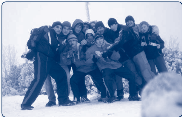
Zimní soustředění na Bílé

Na školu přicházejí studenti z ostravských (1.JC Baník Ostrava, TJ Mittal Ostrava, MěP Ostrava) i z mimoostravských oddílů (TJ Baník Karviná, JC Havířov, atd.). Tréninky judistů a judistek jsou organizovány v Hale TJ Mittal Ostrava na Varenské ulici a v Hale Sareza v Ostravě – Přívoze, kde má tréninkové středisko 1.JC Baník Ostrava. Samozřejmostí jsou i absolvovaná soustředění a to jak školní, tak i reprezentační.