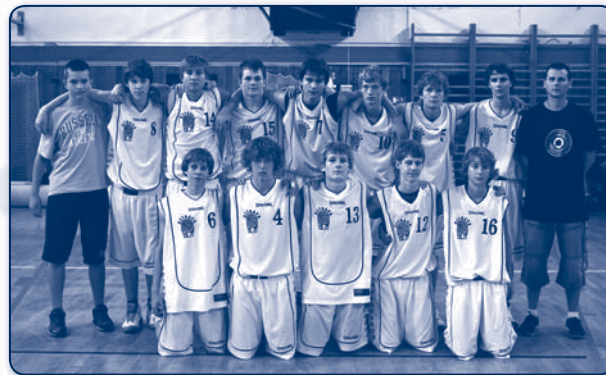
BCM Moravská Ostrava - kadeti