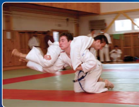
Družstvo dorostenecké ligy