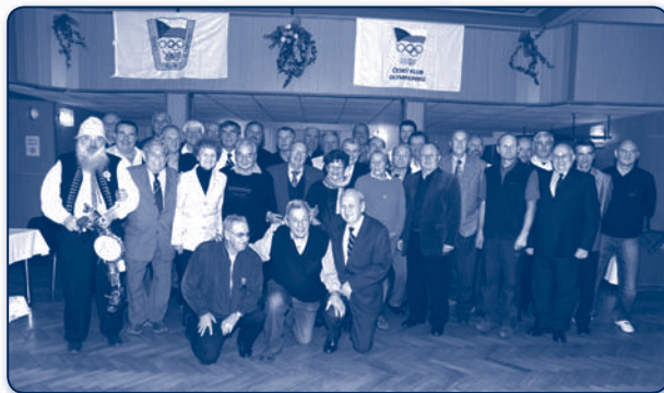
Český klub olympioniků MS kraje

Právě tyto atributy olympijského hnutí učíme naše žáky. Olympijské hry vytváří trvalé sportovní, výchovné a kulturní hodnoty. Olympijské hry nejsou jen vlastním sportovním podnikem, ale mají svůj specifický duchovní obsah, hluboké propojení na výchovu mladých lidí, humanismus a internacionalismus. Každý olympionik je nejen soutěžící, ale je sportovním a kulturním vyslancem své země, sportovního klubu a školy.